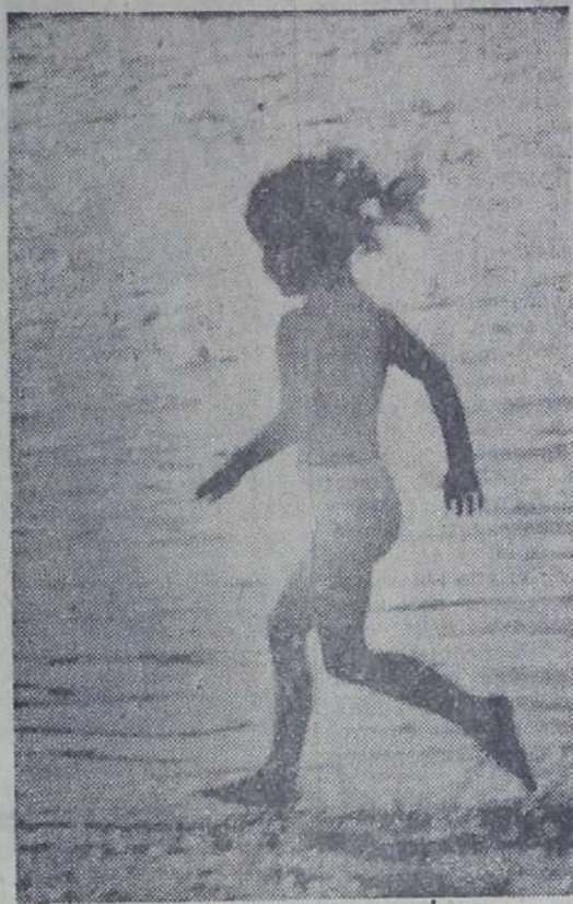
Солнце, воздух и... Волга.