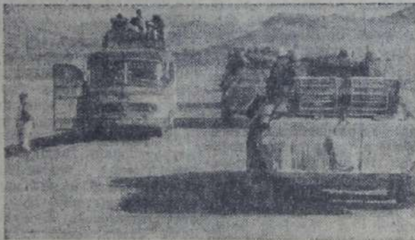
На снимках: на дорогах Кандагара; в гости к мотоотрядам приехал известный певец Николай Гнатюк.